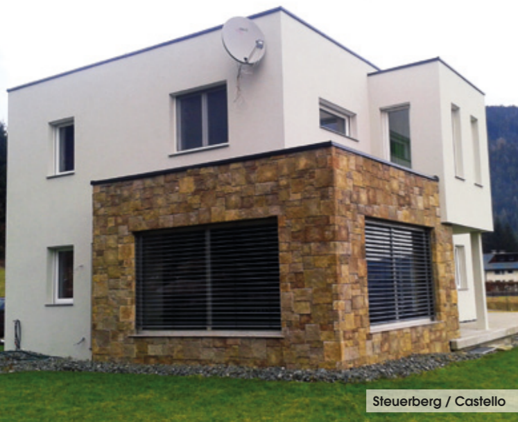
Steuerberg / Castello