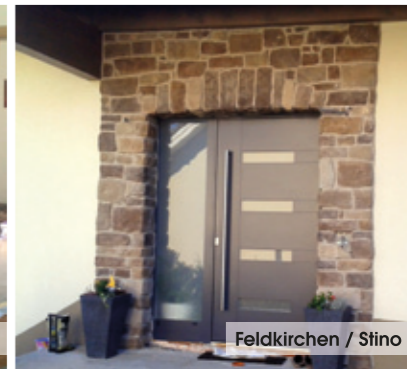
Feldkirchen / Stino