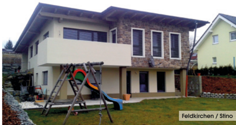
Feldkirchen / Stino