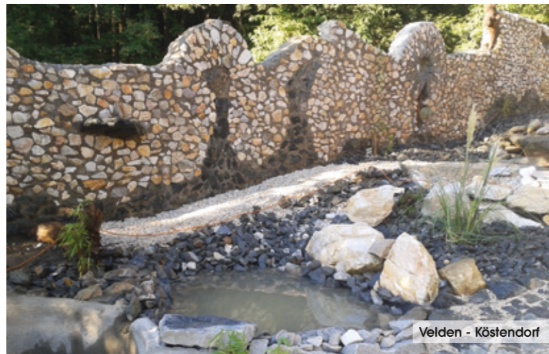
Velden - Köstendorf