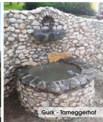
Gurk - Tameggerhof