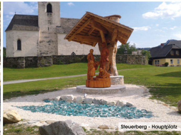
Steuerberg - Hauptplatz