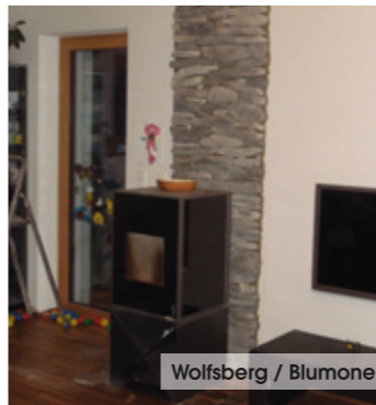
Wolfsberg / Blumone