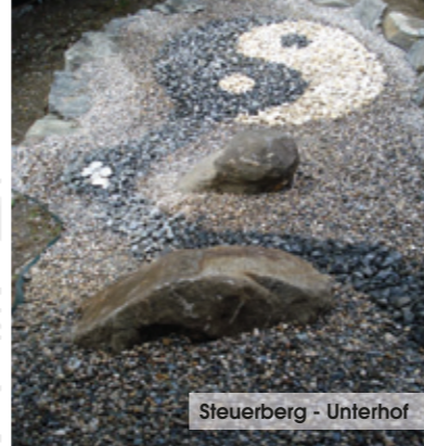
Steuerberg - Unterhof