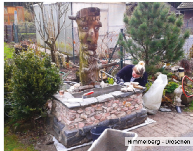
Himmelberg - Draschen