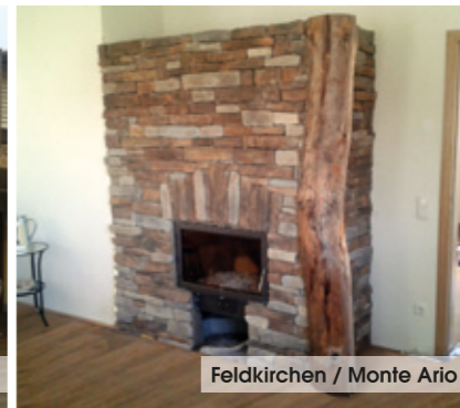
Feldkirchen / Monte Ario