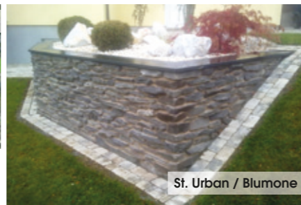
St. Urban / Blumone