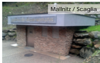
Mallnitz / Scaglia

Wir von der Firma Stonepack verwandeln dieses einmalige Material mit hoher Handwerkskunst zu exkluciver Architektur.