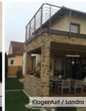
Klagenfurt / Londra